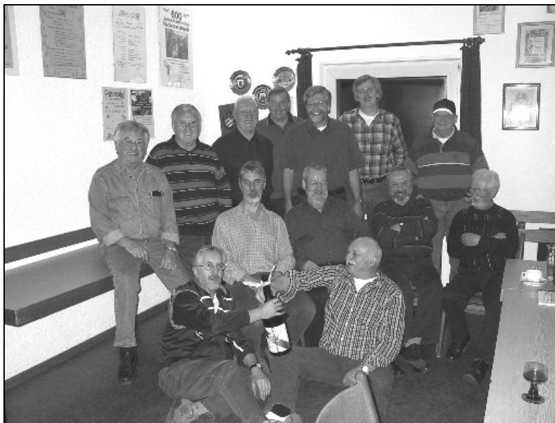
Bild der 25-Jahrfeier